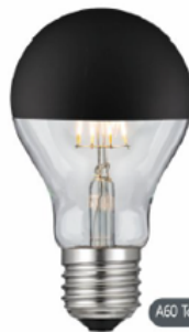
A60 Top matt black