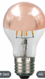
A60 Top Rose Gold