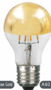
A60 Top Gold