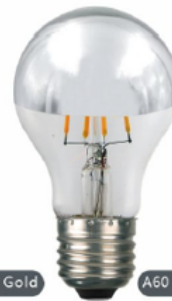
A60 Top Silver